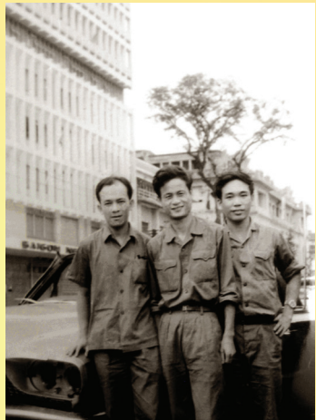
Cán bộ Ngân Hàng trong quân phục giải phóng ngày đầu tại bến Chương Dương