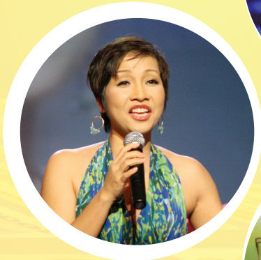
Ca sỹ Mỹ Linh