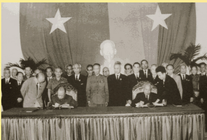
Lễ ký biên bản giữa 2 miền Nam - Bắc (Hội nghị hiệp thương thống nhất 2 miền đất nước)