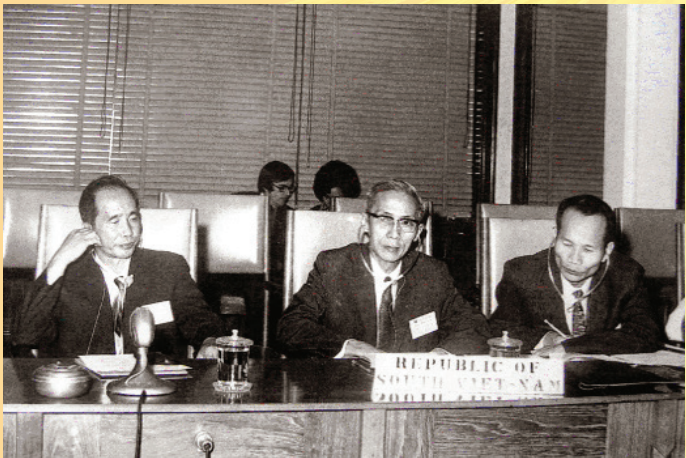
Hội nghị ESCAP ở Bangkok tháng 9 - 1975

Ngân hàng Nhà nước Việt Nam đã khẩn trương tiếp quản và cải tạo hệ thống ngân hàng của chế độ cũ ở miền Nam, xây dựng hệ thống ngân hàng mới của chính quyền cách mạng, thực hiện thống nhất tiền tệ trong cả nước, ban hành và thực hiện nhiều biện pháp về tiền tệ, tín dụng, quản lý ngoại hối, thanh toán để góp phần ổn định tình hình kinh tế và lưu thông tiền tệ, đáp ứng nhu cầu vốn và tiền mặt cho sản xuất, quốc phòng, an ninh và đời sống kinh tế - xã hội; mở rộng hợp tác quốc tế, tranh thủ sự giúp đỡ của bạn bè quốc tế cho công cuộc tái thiết đất nước. Ngày 2/5/1978, đồng tiền mới của Ngân Hàng Nhà Nước chính thức được phát hành trên toàn lãnh thổ Việt Nam, đánh dấu một thời kỳ phát triển mới của tiền tệ nước ta.