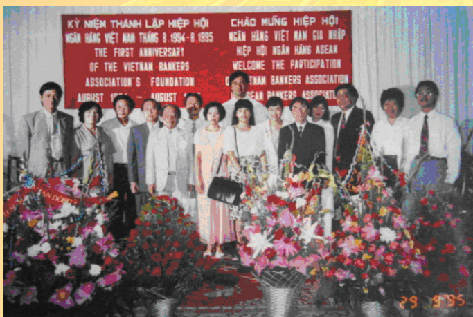
Hiệp hội Ngân Hàng Việt Nam gia nhập Hiệp hội Ngân Hàng Aseam 1995

Trải qua thời gian, con đường tiền tệ vẫn tiếp tục được đắp xây. Tiếp bước truyền thống vẻ vang của thế hệ đi trước, các cán bộ ngành Ngân hàng luôn nỗ lực phấn đấu, bằng trí tuệ và bản lĩnh của mình đưa con đường ấy luôn đi đúng hướng, góp phần phát triển kinh tế - xã hội, xây dựng đất nước Việt Nam ngày càng bền vững, tươi đẹp.