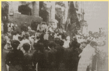
Tuần lễ vàng 1945

Điểm đặc biệt trong giai đoạn này là việc ngân hàng nằm chính trong nhân dân, “ngân hàng không có khóa”, vì tất cả tiền bạc đều gửi nhân dân giữ hộ, không bao giờ thiếu hụt một xu, một cắc, khi cần mới thu lại, khi thiếu tiền thì viết giấy vay của nhân dân, hện kháng chiến thành công sẽ trả... Đó là những năm tháng không thể nào quên, những năm tháng tràn đầy lòng tin của nhân dân với Đảng, với Chính phủ và Bác Hồ kính yêu.