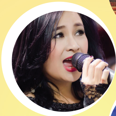
NSƯT Thanh Lam