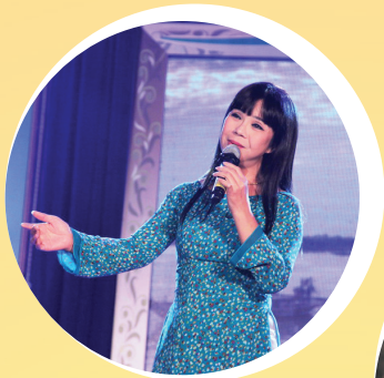
NSƯT Ánh Tuyết