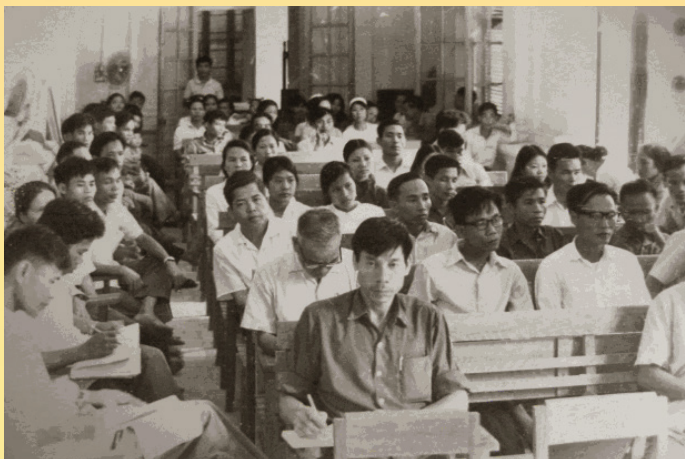
Lớp học nghiệp vụ Ngân Hàng những năm đầu giải phóng đất nước