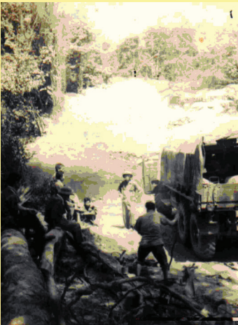
C.32 đón đoàn xe chở hàng và tiền từ Miền Bắc vào