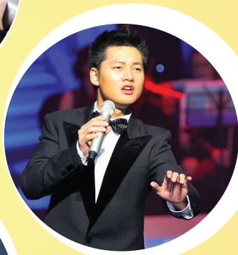
Ca sỹ Đức Tuấn