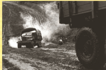
Xe chở hàng và tiền từ Miền Bắc vào